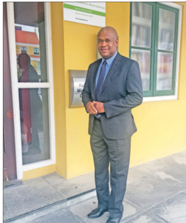
Secretaris-generaal van Sharlon Melfor.

TExperience is een bedrijf met ervaring in het organiseren van evenementen en crowd management. In verband met